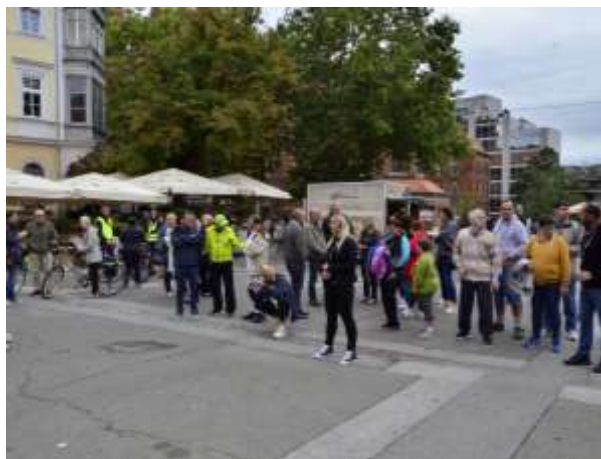
Invalidi se predstavijo na Trgu Svobode Maribor