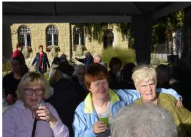
Prijetne družbe ni nikoli preveč