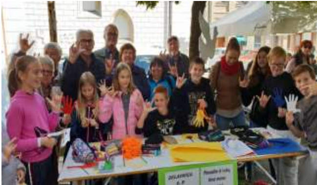
Otroci in mladi skupaj z nami gluhi

Na letošnji prireditvi smo gluhi opozarjali na pravica gluhih, da pridobijo svoj jezik t.j. znakovni jezik od samega rojstva. Identiteta gluhih opredeljuje gluhe kot pripadnike kulturne in jezikovne skupnosti, ki uporablja znakovni jezik kot materni ali naravni jezik za sporazumevanje.