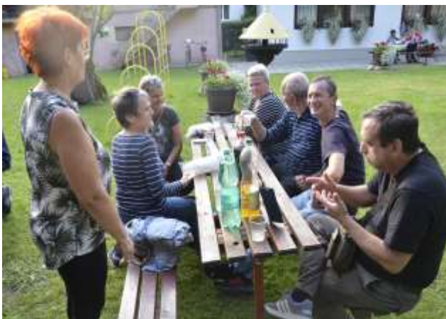
Zabavni trenutek med člani