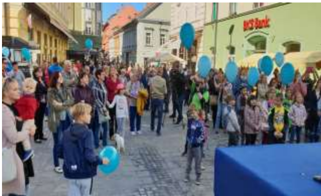
Prireditev na prostem

Invalidi sluha in govora so pogosto ovirani pri zadovoljevanju svojih osnovnih potreb in interesov.