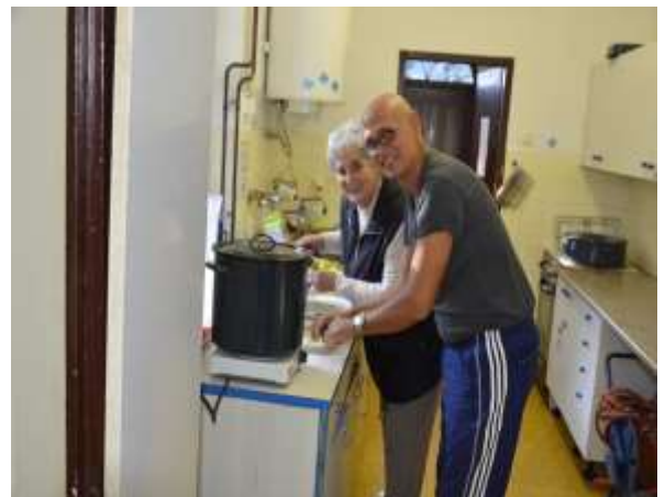
Priprava hrane v kuharski delavnici