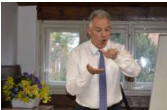
Vodenje informativne okrogle mize

Zmožnost znakovnega jezika za sporazumevanje in zagotavljanje tolmačev pomeni, da imajo gluhe osebe enake možnosti zaposlovanja. Gluhe osebe potrebujejo dostop do javnih informacij in storitev preko tolmačenja v znakovnem jeziku, podnaslavljanja in drugih ustreznih tehničnih rešitev. Če se gluhim osebam odvzame osnovna pravica do uporabe lastnega jezika, so te pravice močno okrnjene.