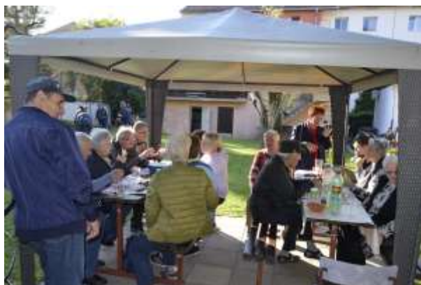
V dobri družbi

Imeli smo se lepo, kot vsako leto, saj smo vsi prinesli s seboj obilico dobre volje.