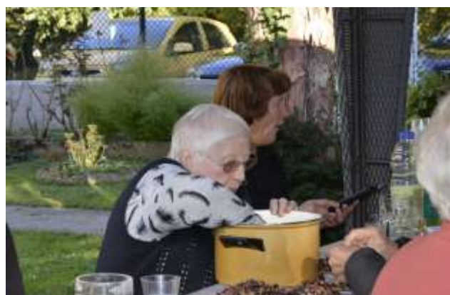
Kostanjev je hitro zmanjkalo