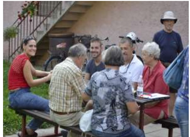
Veselje med zbranimi