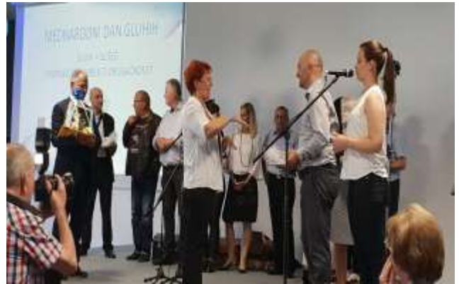
Čestitke in priznanja

Da gluhoti ne bo ovira, temveč most, ki tako gluhe kot slišče poveže v eno skupnost v kateri živimo, se učimo in si medsebojno pomagamo.