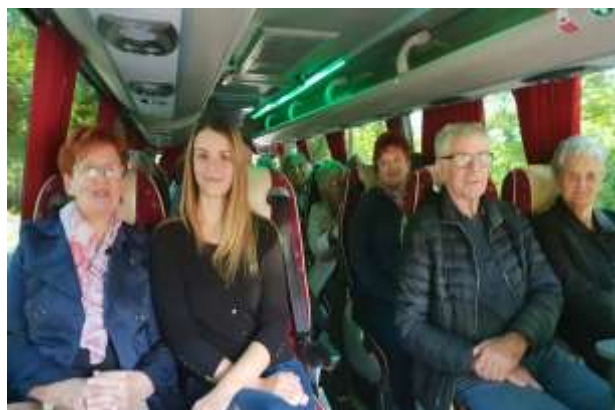
Na avtobusu proti Celju

Slavnostna akademija s kulturnim programom je bila v soboto, 21. septembra 2019, ob 13. uri v Celjskem domu.