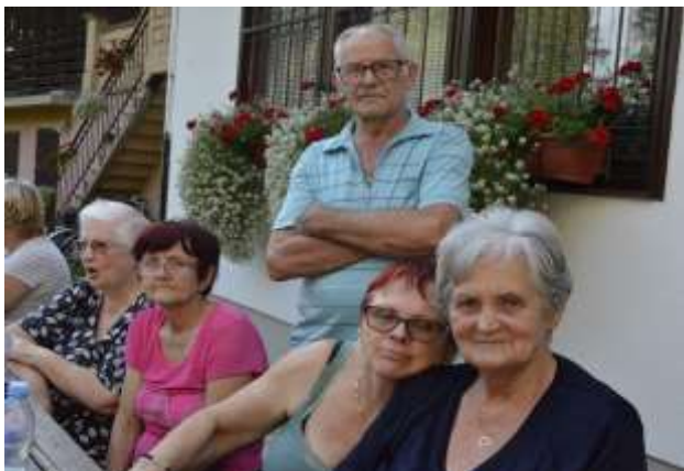
Imamo se radi