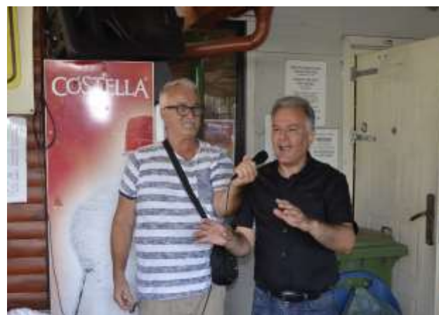
Sead v vlogi novinarja