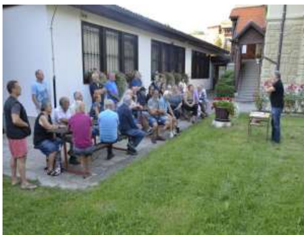
Info okrogla miza na svežem zraku