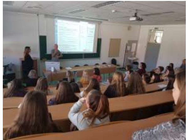
Predstavitev gluhot na Srednji zdravstveni šoli