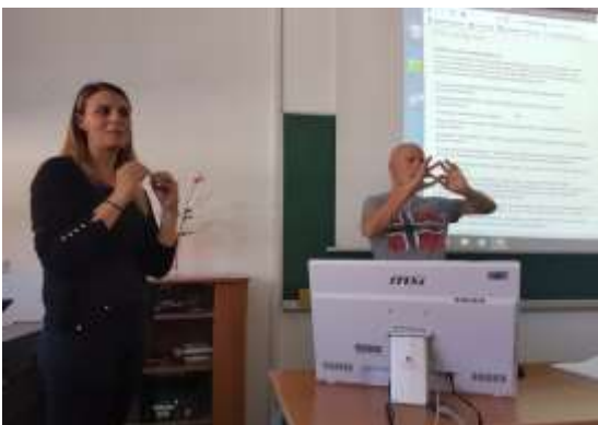
Predavanje na Zdravstveni šoli v Mariboru

Nedopustno je dejstvo, da še do danes gluhi otroci v osnovni šoli nimajo predmeta slovenski znakovni jezik in se ne morejo učiti v svojem maternem jeziku.