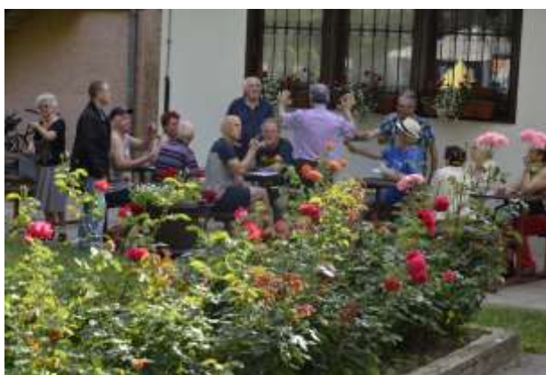
Druženje na svežem zraku

Eden od načinov za zmanjševanje onesnaženosti okolja je ločeno zbiranje in predelava odpadne embalaže. Recikliranje odpadnega papirja nam daje priložnost, da rešimo neznanske količine dreves. Za 1 tono papirja moramo posekati kar 17 malih ali 2 veliki drevesi. Zato z zbiranjem in recikliranjem papirja ohranjamo naše gozdove, varčujemo z energijo in skrbimo za čisto okolje in zrak.