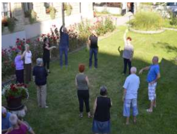
Razgibavanje in telovadba na dvorišču