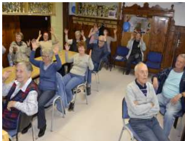
Sodelovanje na kvizu znanja