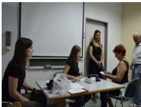
Merjenje krvnega tlaka: »Bodi fit«