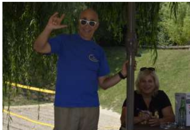
Razpoložena sodelavca v DGNP