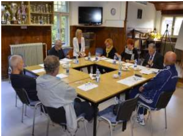
Zasedanje upravnega odbora