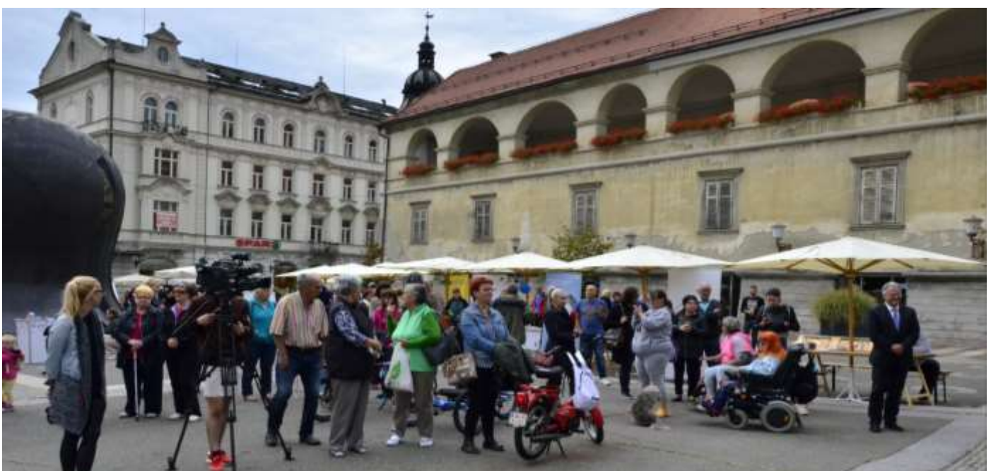
EVROPSKI TEDEN MOBILNOSTI INVALIDOV