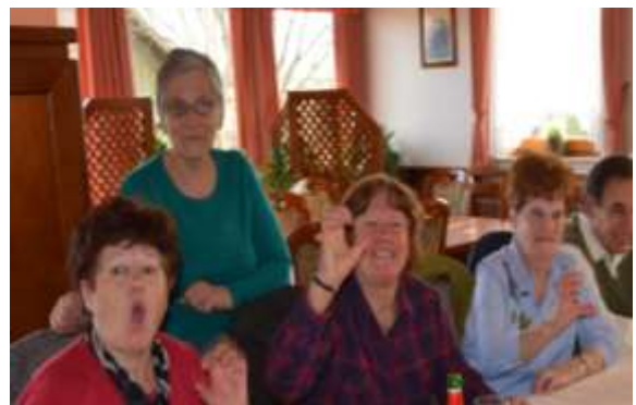
Tekmovanje na kvizu