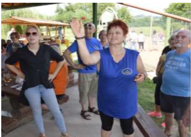
Natančni ciljanje in radovedni pogledi