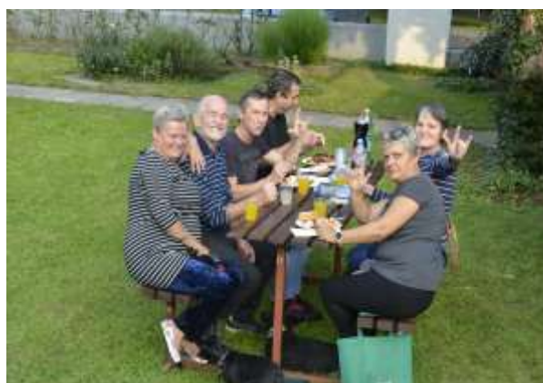
Uživanje v prelepi naravi.

Negativen vpliv na okolje povzroča že izdelava nagrobnih sveč. Sveče so bile včasih le iz čebeljega voska, zdaj so večinoma plastične; ob njih so še keramične, steklene ali elektronske. Ker je prižiganje sveč, posebno ob prvem novembru, tradicionalno in ima velik pomen, lahko ravno pri izbiri sveče veliko pripomoremo k varovanju in ohranjanju naše lepe narave.