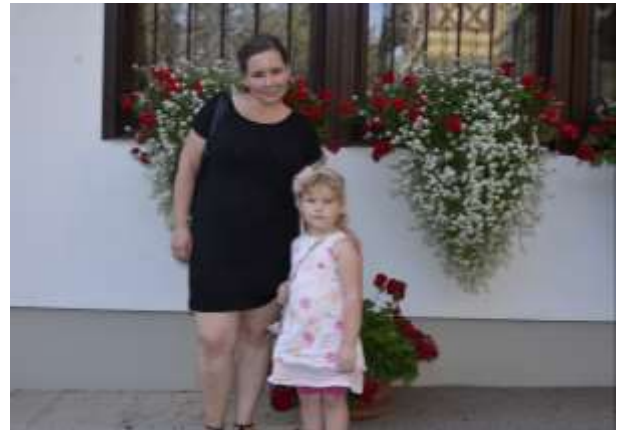
Mama in hči med cvetjem