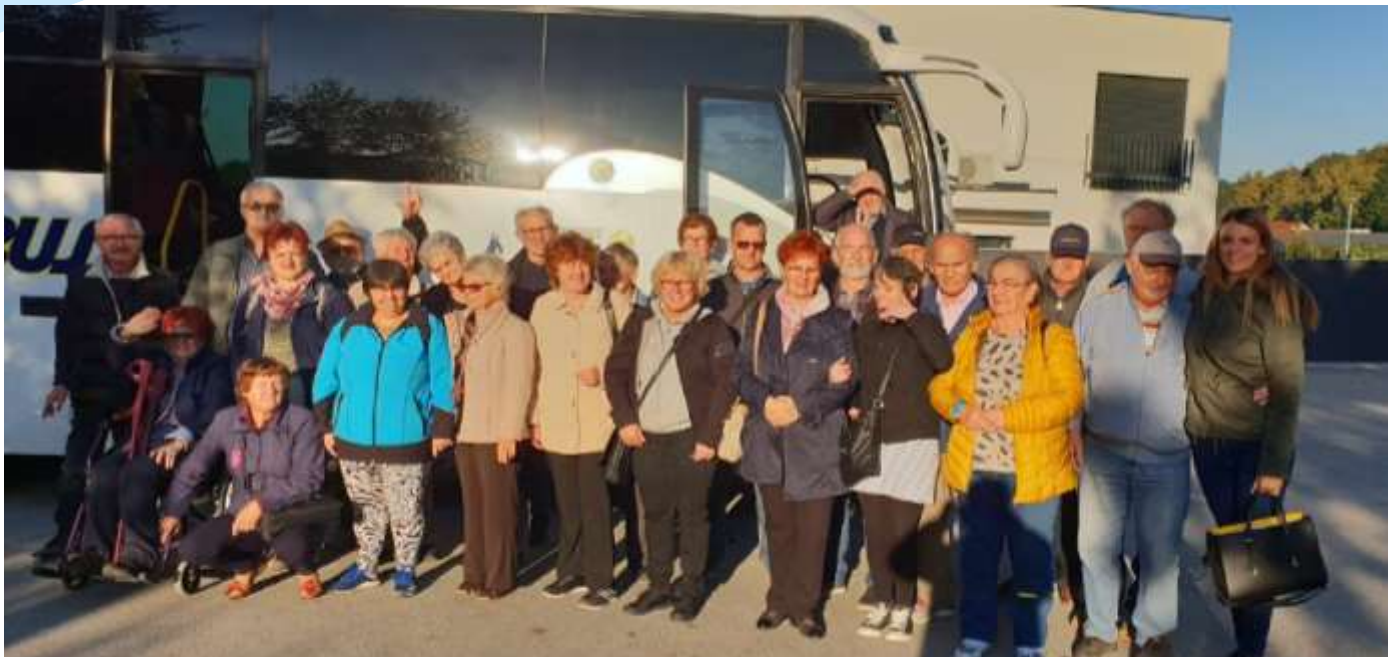
MEDNARODNI DAN GLUHIH