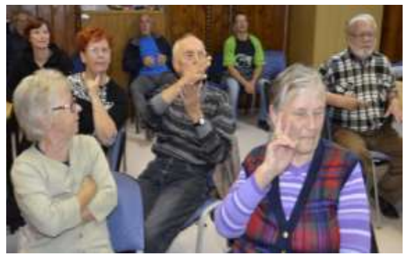
Razprava med člani

Zveza društev gluhih in naglušnih Slovenije si prizadeva, da bi slovenski znakovni jezik v ustavi bil priznan kot uradni jezik gluhih. Slovenščina gluhim namreč predstavlja tuj jezik, poudarjajo; njihov prvi jezik je znakovni.