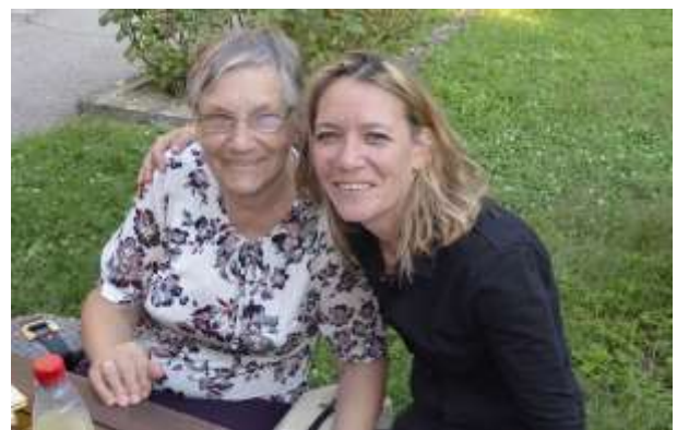
Spoštovanje starejših in mlajših

Vsem dobrim stvarjem je namenjeno, da trajajo vse življenje. (Peter Gray)