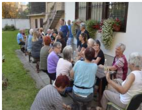
Družabništvo na prostem