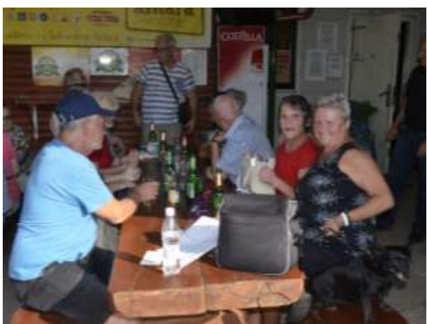
Sproščena družba v družbi ljubljénka